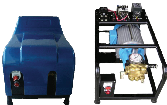
高圧ポンプ High-pressure pump